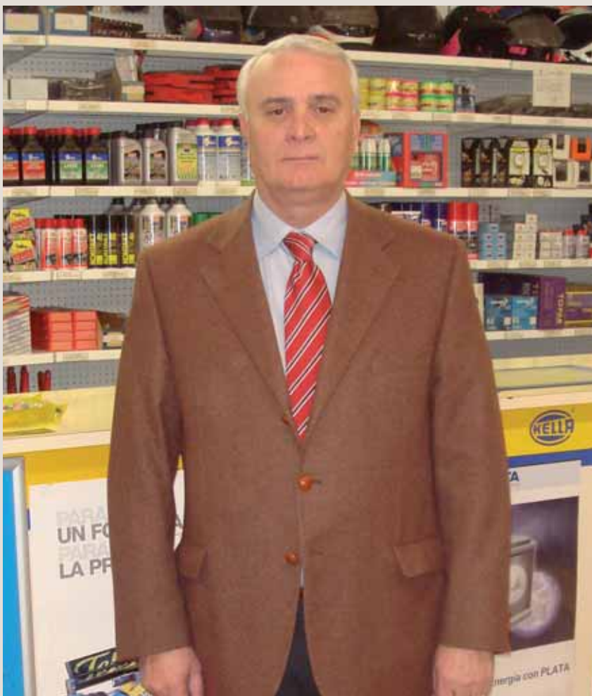
Seguimos teniendo una alta cuota de mercado.

Las relaciones con los talleres por parte de los recambistas son y tienen que seguir siendo buenas, no olvidemos que somos como las vías del tren: no podemos separarlas, sino el tren descarrilaría.